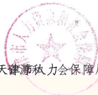
天津市人力资源和社会保障局