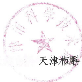
天津市科学技术局