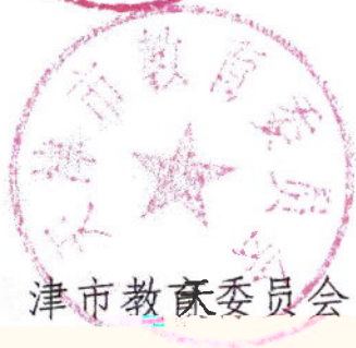
天津市教育委员会